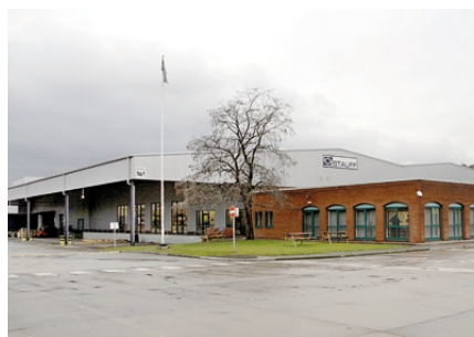
STAUFF Head Office in Sheffield

Nachdem auch die SAP-Anbindung zur Verfügung stand, fand der Projektstart zunächst in England für die dortigen registrierten Vertriebskunden statt. Der Konfigurator wurde im November 2009 für den englischen Markt produktiv gestellt. In der weiteren Planung befinden sich eine deutsche sowie auch eine italienische Variante des Webshops. In Phase II des Projektes sieht man vor, den Webshop auch für die Endkunden zugänglich zu machen.